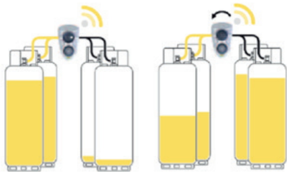
Switch naar reserve

Het systeem bestaat uit 2x2 geschakelde propaanflessen van 10,5 kg per stuk, die aan elkaar zijn gekoppeld. Is de ene groep gasflessen leeg, dan schakelt het systeem automatisch over naar de volgende groep. Overschakeling wordt, door middel van telemetrie in de schakelunit, automatisch geregistreerd en online gemeld. Uw gasleverancier plant vervolgens een afspraak om de lege flessen te verwisselen voor volle. Dankzij dit systeem kunt u onbezorgd van uw gashaard blijven genieten.